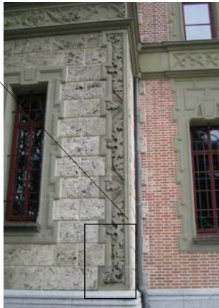
BE, Thun, Schadau castel, 18.09.2008

Stony Materials and conservation of the built heritage - Introduction - BR 8