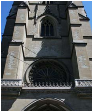
FR, Fribourg, cathedral, 31.07.2010