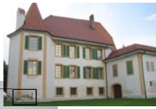
FR, Mézières castle, 01.07.2009

Story Materials and conservation of the built heritage - Introduction_BR /10