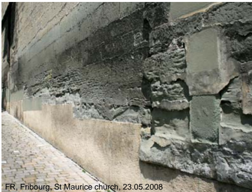
FR, Fribourg, St Maurice church, 23.05.2008

Stony Materials and conservation of the built heritage - Introduction - BR 9