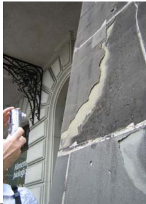
FR, Fribourg, Rue du Tilleul, 29.05.2008

Stony Materials and conservation of the built heritage - Introduction - BR 7