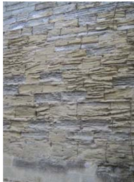
FR, Fribourg, rampart, 28.03.2007